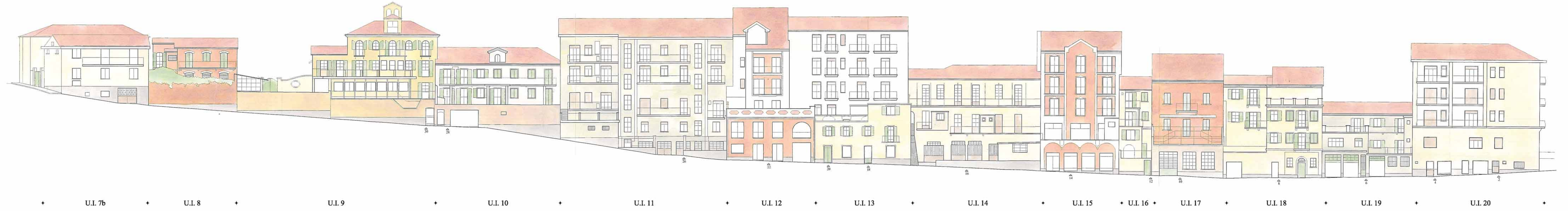
PROGETTO SEZIONE C-C VIA MOLINA NUMERI PARI (dal n. 2 al n. 30)