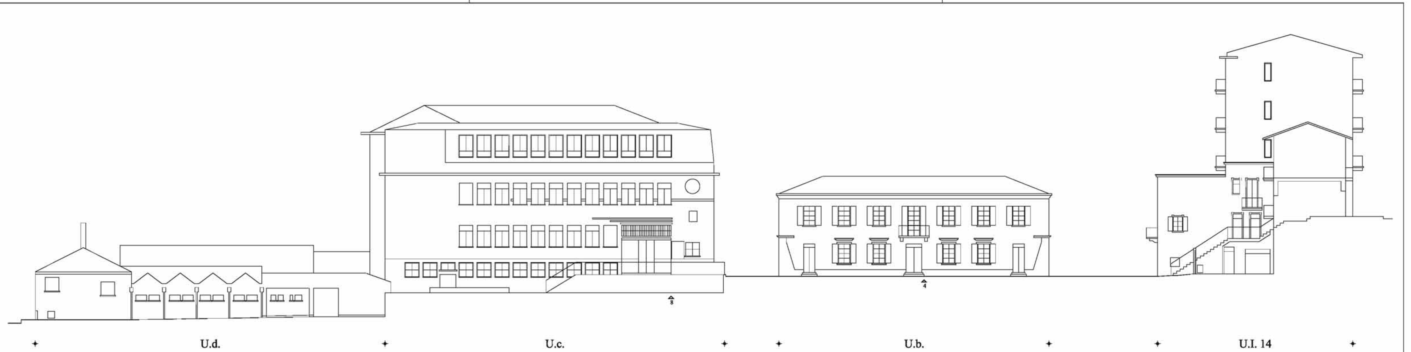
RILIEVO SEZIONE F-F PIAZZA DEL MUNICIPIO NUMERI PARI (dal n. 4 al n. 8)