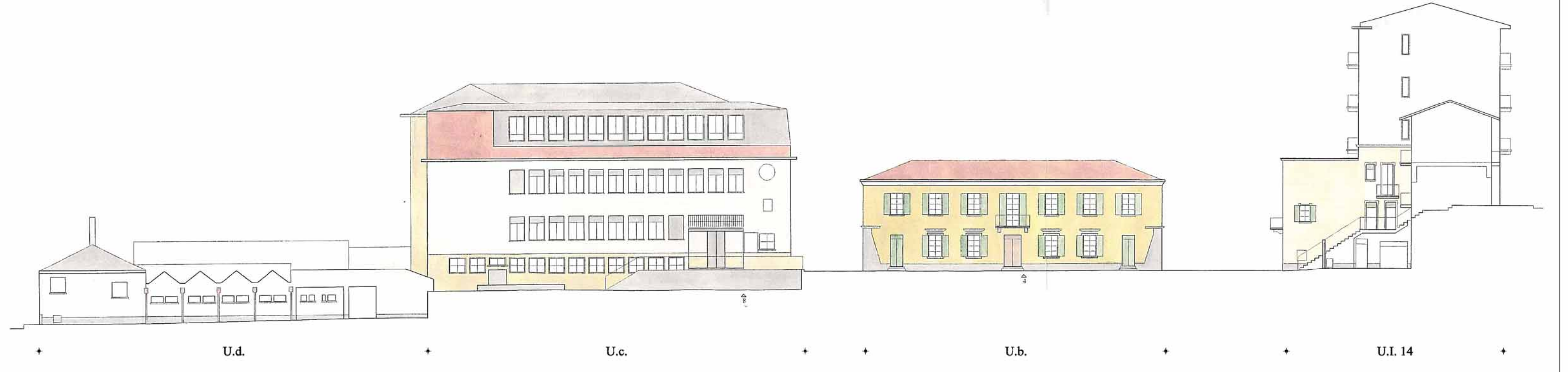
PROGETTO SEZIONE F-F PIAZZA DEL MUNICIPIO NUMERI PARI (dal n.4 al n. 8)