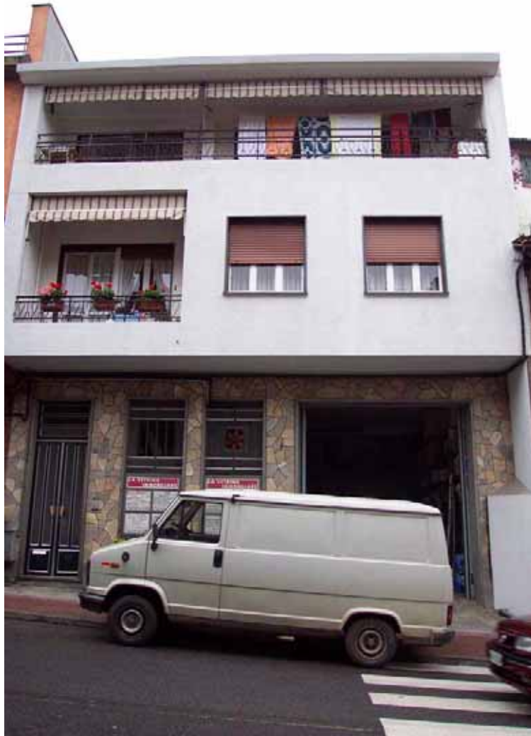
U.I. 48/49 U.I. 50 e 51