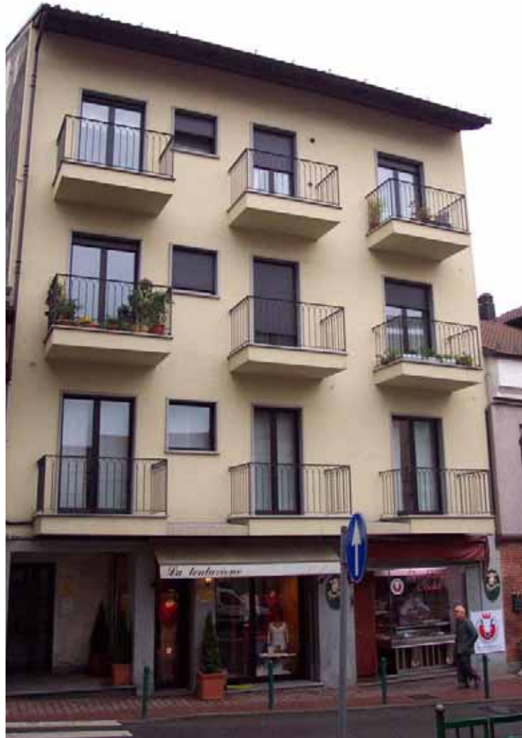
U.I. 53 U.I. 54