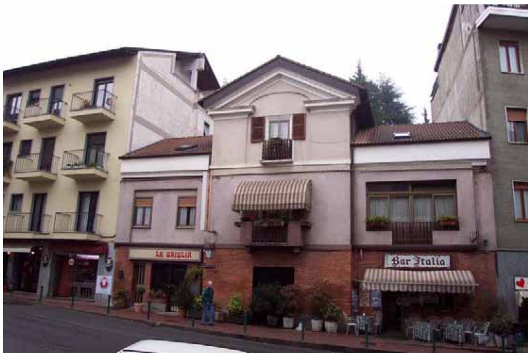
Sezione A-A VIA ROMA