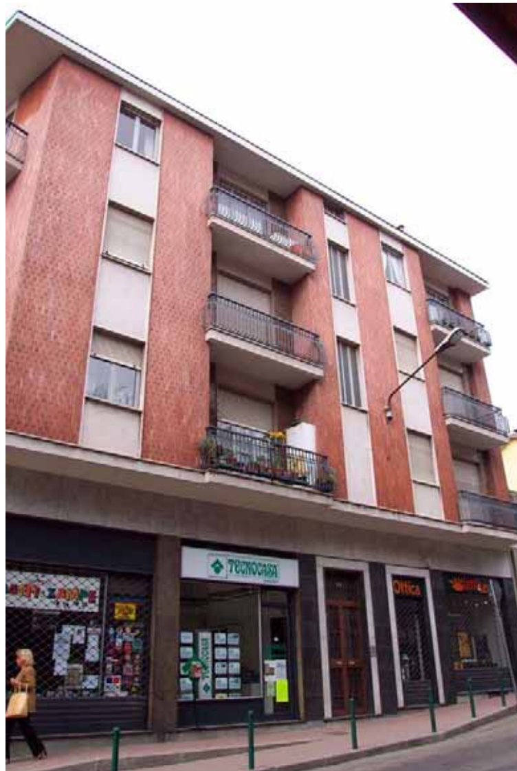
U.I. 20 U.I. 19