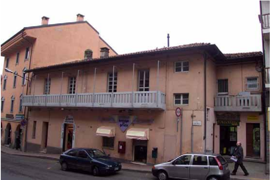
U.I. 14 e 14 bis U.I. 14