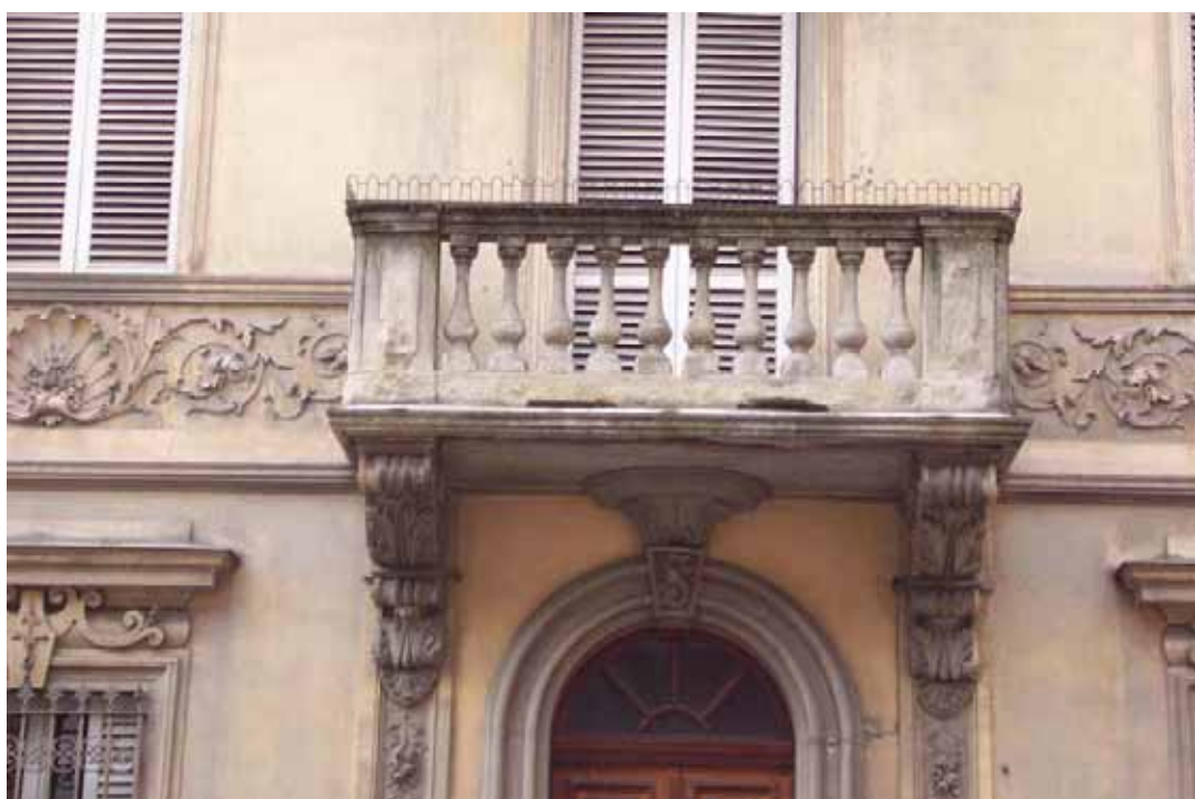
Sezione B-B VIA ROMA