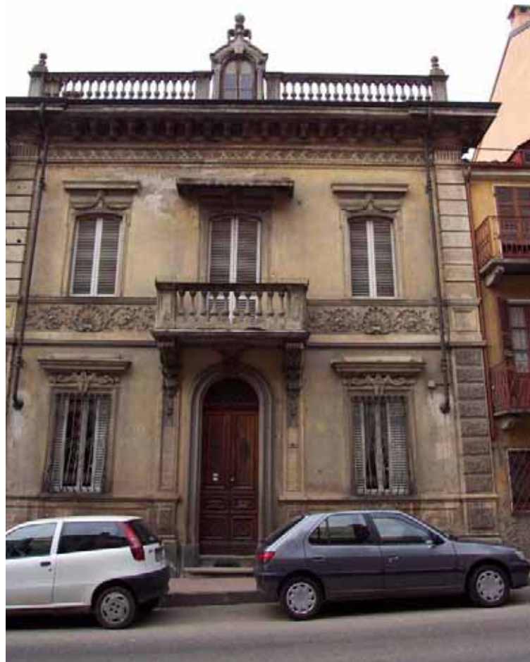
U.I. 17 U.I. 17